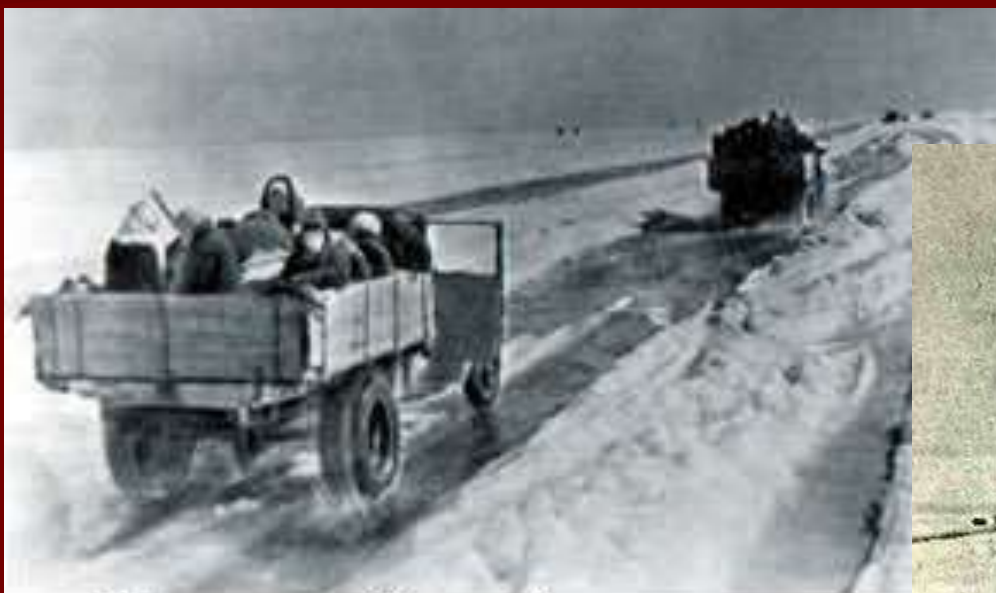
“Дорога жизни” через Ладожское озеро

В первых числах декабря лед окреп и машины ездили не опасаясь провала. Движение грузового автотранспорта не прекращалось практически ни на один день. Было доставлено 16 449 т грузов, что позволило с 25 декабря несколько увеличить хлебный паек.